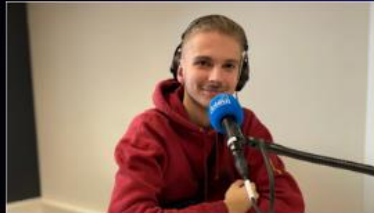
Un jeune étudiant grenoblois de 18 ans participe aux championnats de France de beatbox - France Bleu Les championnats de France de beatbox se déroulent ce vendredi 25 et samedi 26 novembre. Une pratique artistique qui consiste à faire de la musique en utilisant des instruments avec sa bouche. La compétition se...