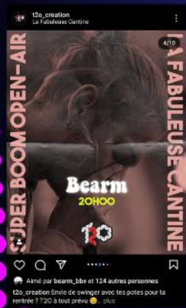
Amid par bearm, lbb et 124 autres personnes t2o_creation invite de s'enjoindre avec les potes pour la rentrée ? T2O à tout prévu plus