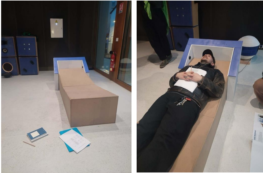
Atelier de l'ENSASE, 11 février 2026, création d'une « chaise musicale » Exposée dans le bâtiment A du site tréfilerie, Saint-Étienne

corps (l'art n'est plus seulement conçu comme un spectacle qui doit émerveiller, mais doit davantage marquer le corps et l'esprit, c'est dans cette dynamique que s'inscrivent les réflexions autour du larsen ou du feedback pour Fils Cara).