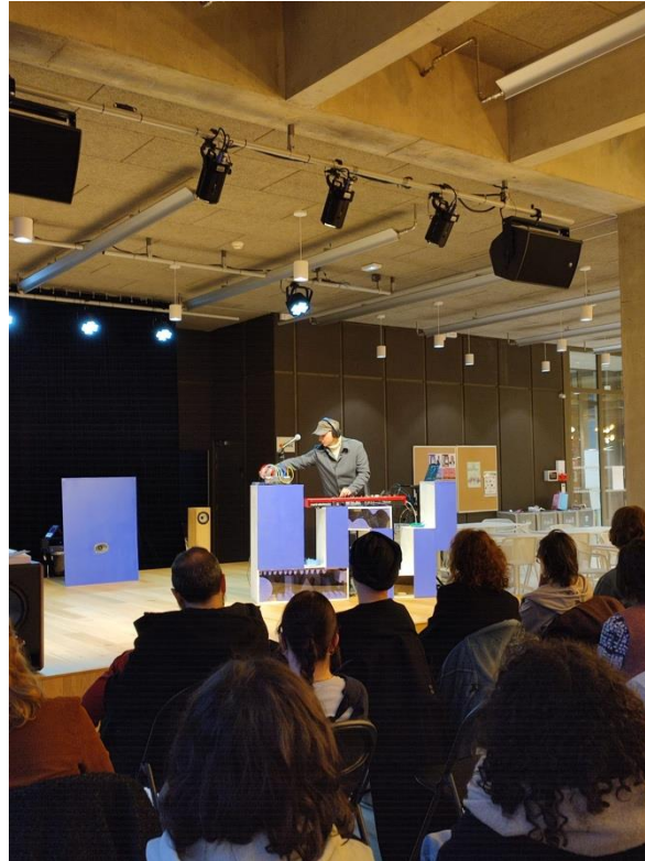
Le 12 février 2026, showcase de Fils Cara dans le bâtiment 1 du site Tréfilerie

Durant les prochaines séances, les étudiant.es amèneront avec eux des objets, issus de leurs pratiques personnelles (de musique ou autre) qui pourront servir à la constitution du KlangAtlas et qui pourront permettre d’appréhender la notion de larsen et de la mettre directement en œuvre. Cet « Atlas », en ligne, pourra être alimenté au fur et à mesure des échanges, pour permettre de constituer un objet fini, un outil, en fin d’atelier.